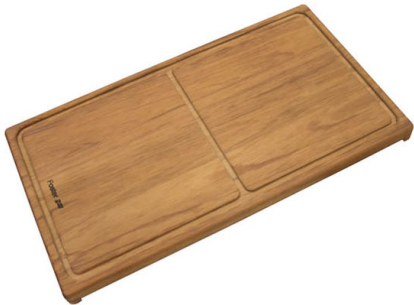
Tagliere scorrevole in legno Iroko 8643 000