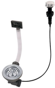
Piletta automatica 8407 100